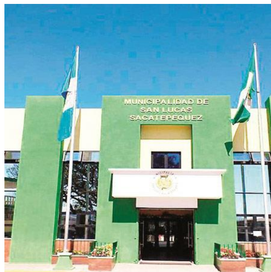
Municipalidad de San Lucas Sacatepéquez, Sacatepéquez